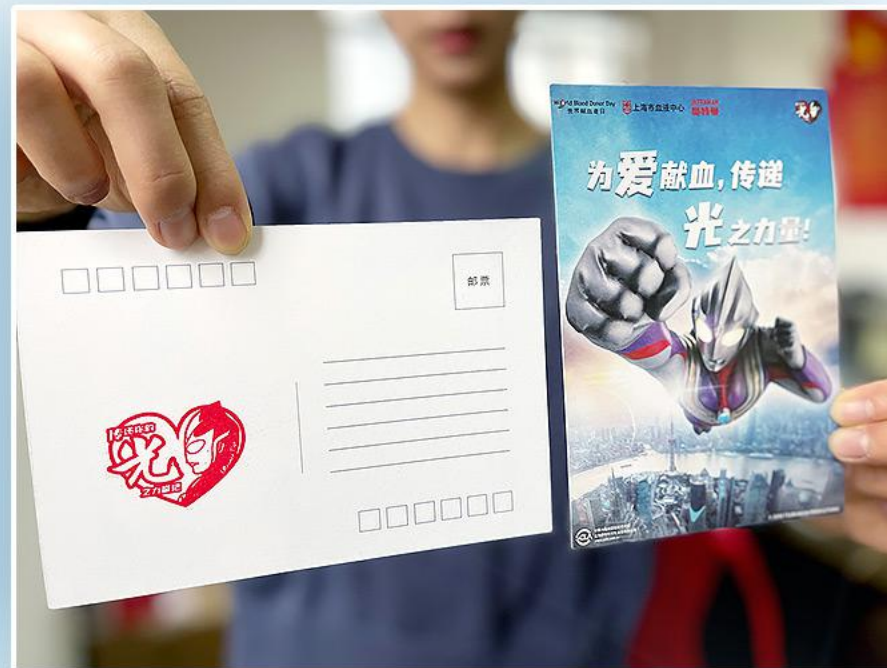
▲ ウルトラマンティガ チャリティースタンプとハガキ