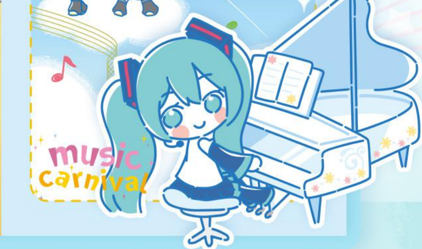
▲ 素材&商品イメージ図