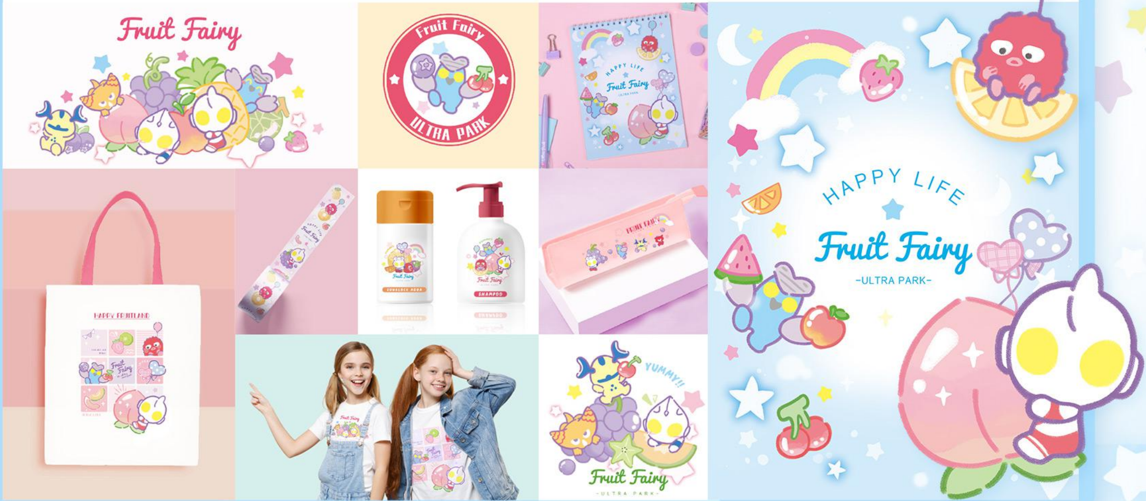
▲ 素材 & 商品イメージ図

ウルトラパークはSCLAがファミリー層及び女性総の市場ニーズを答えるため開発した新しいシリーズ