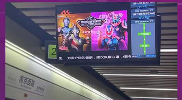
▲ 上海市営バス及び地下鉄にても宣伝