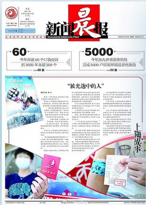
▲ 上海販売数No.1朝刊新聞 新闻晨报のトップ記事