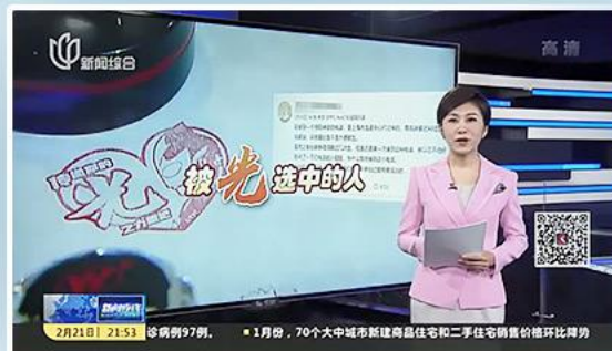
▲ 中国最も影響力があるチャンネルの一つ 上海ニュース総合チャンネルに報道