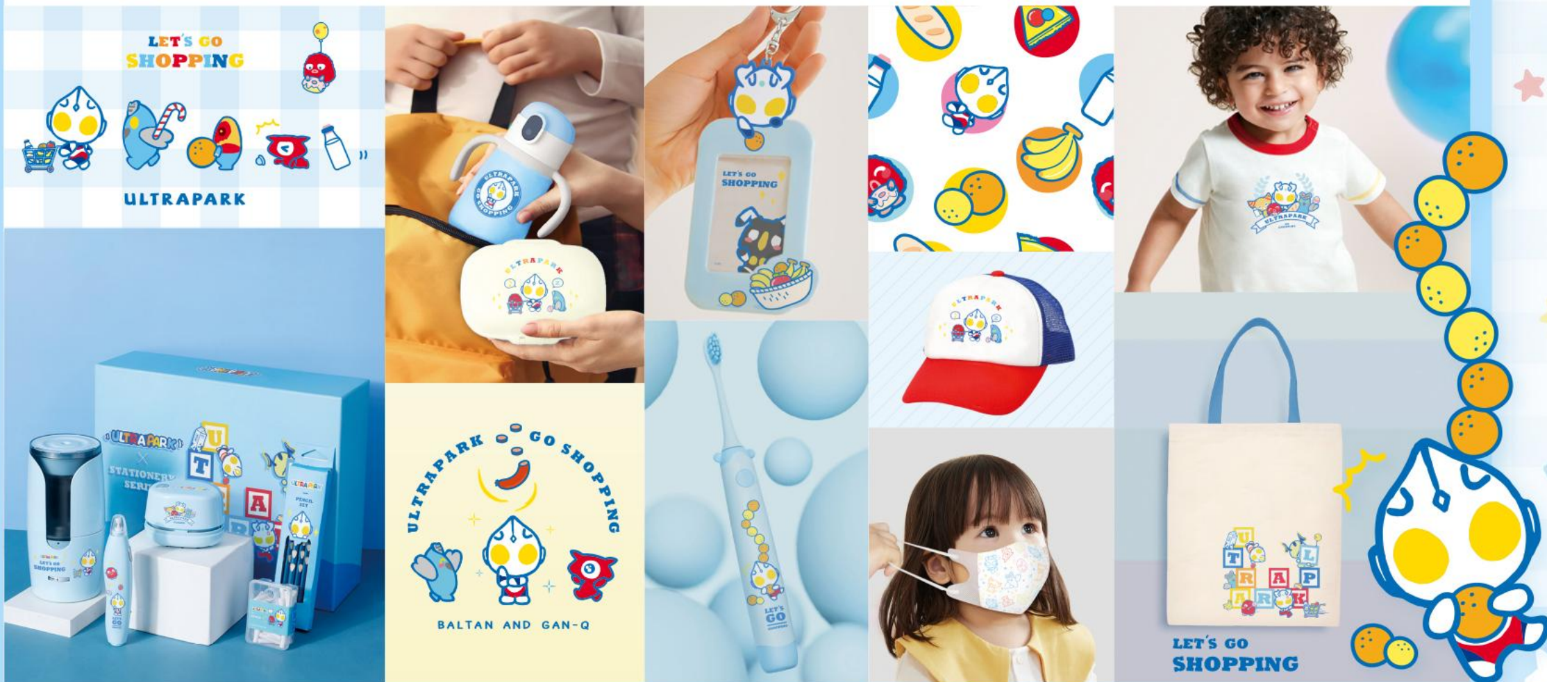
▲ 素材 & 商品イメージ図