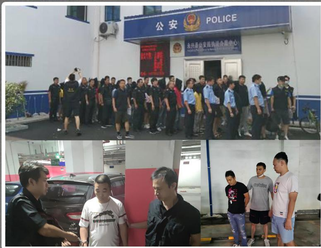
▲ 容疑者逮捕の現場