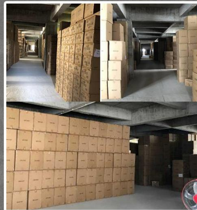
▲ 一部偽物商品の金型