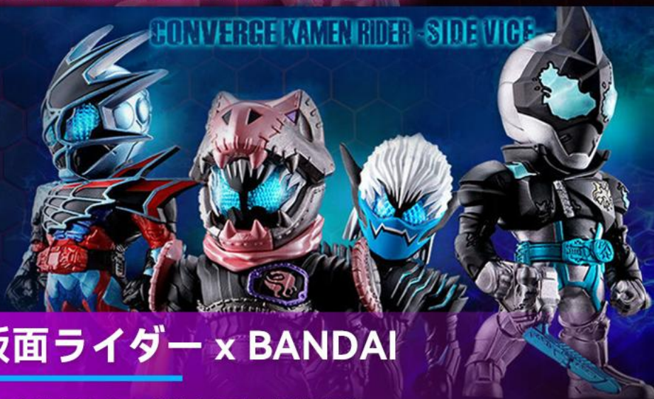
CONVERGE KAMEN RIDER -SIDE VICE-