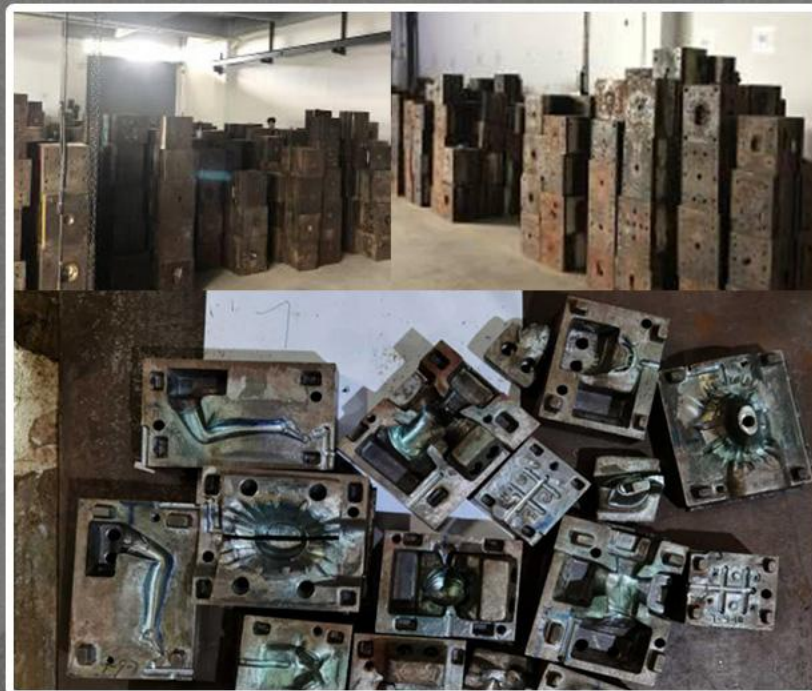
▲ 一部偽物商品の在庫