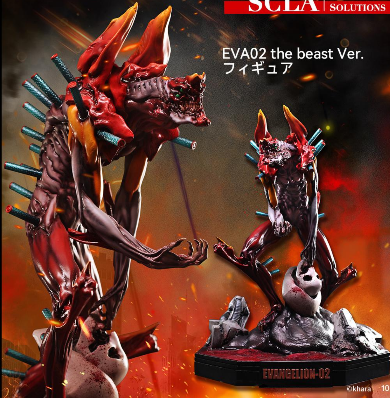
EVA02 the beast Ver. フィギュア