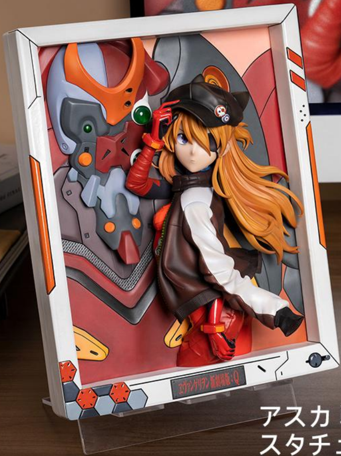
アスカ 戦闘服Ver. スタチューフォトフレーム