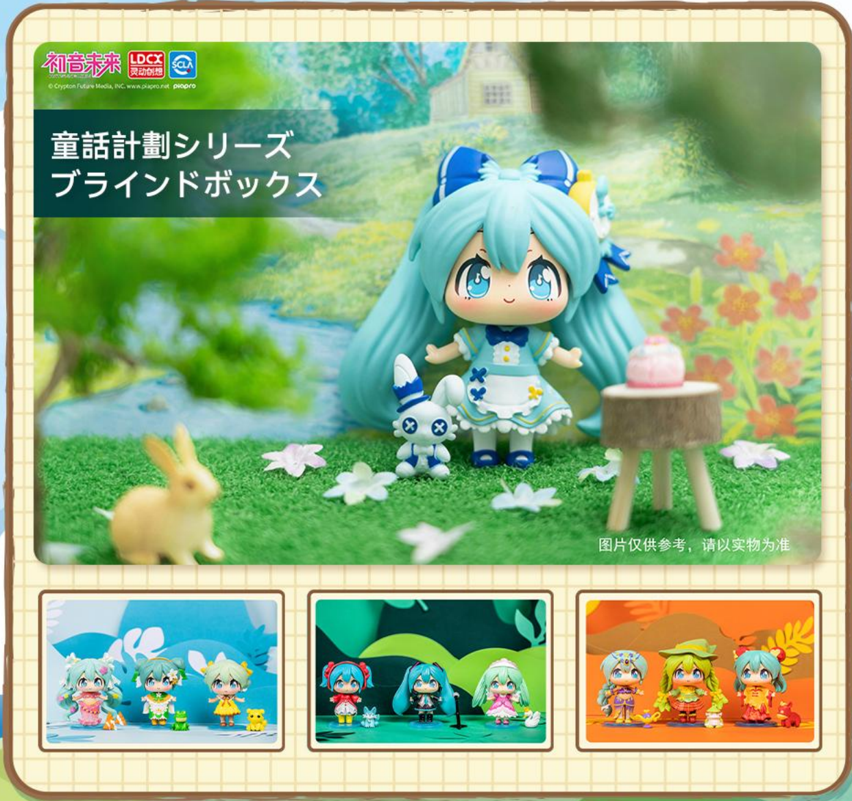
图片仅供参考，请以实物为准