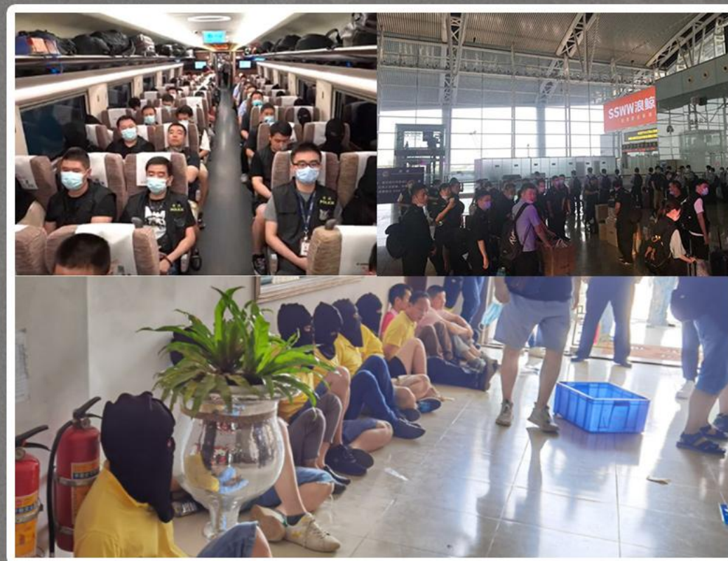
▲ 広州、湖南、安徽から容疑者を上海に押送