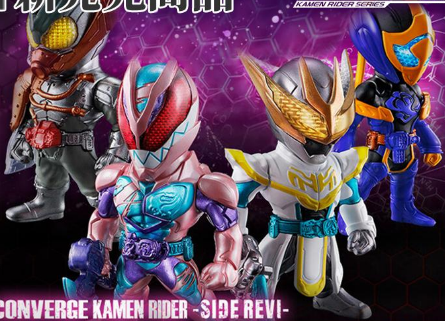
CONVERGE KAMEN RIDER -SIDE REVI-