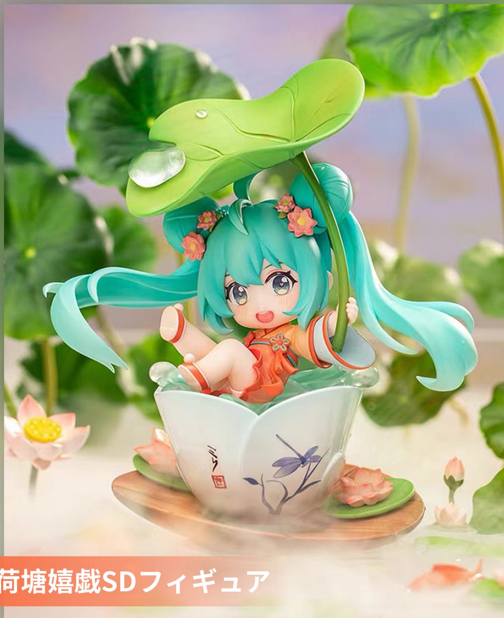
荷塘嬉戲SDフィギュア