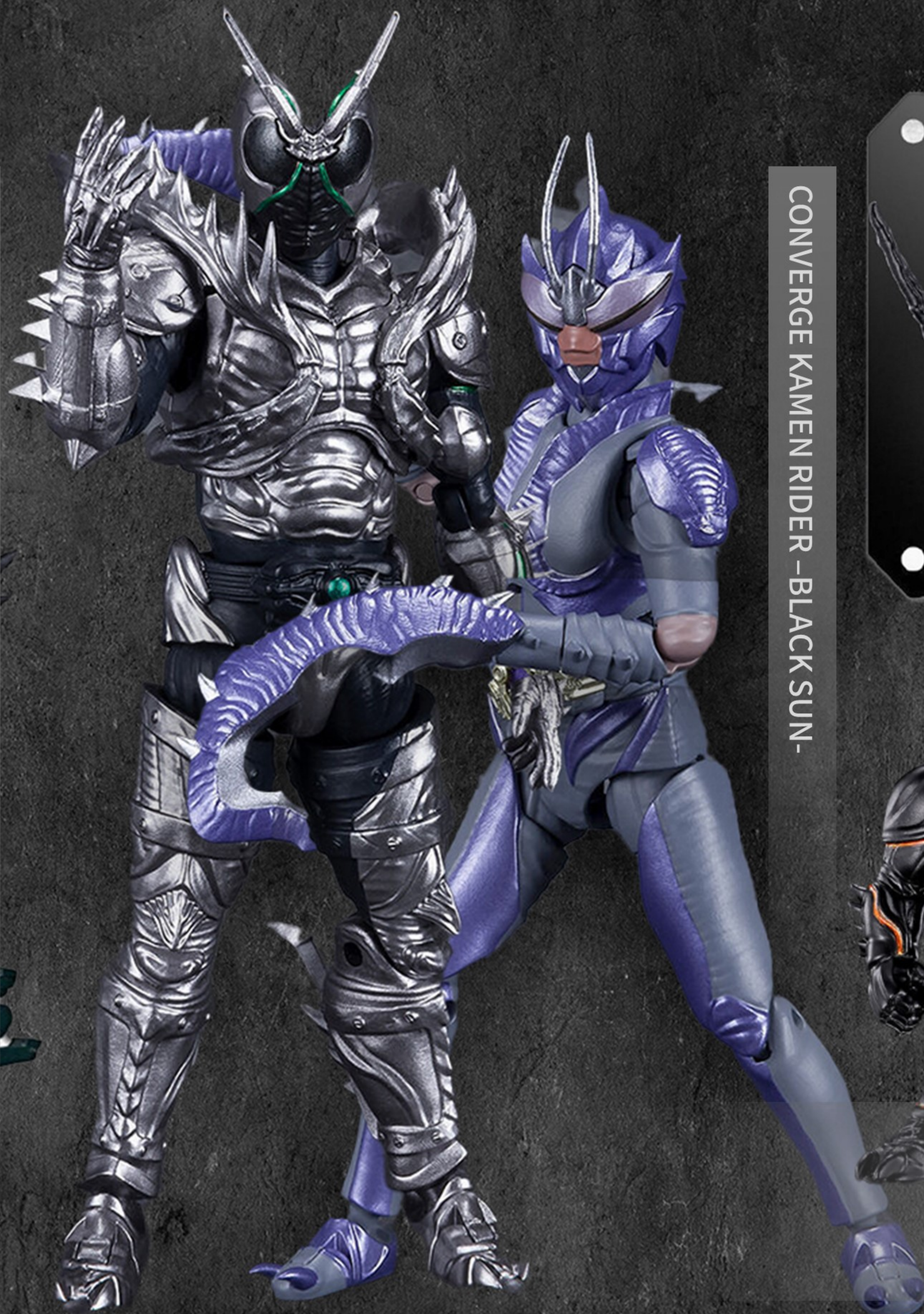
CONVERGE KAMEN RIDER - BLACK SUN -