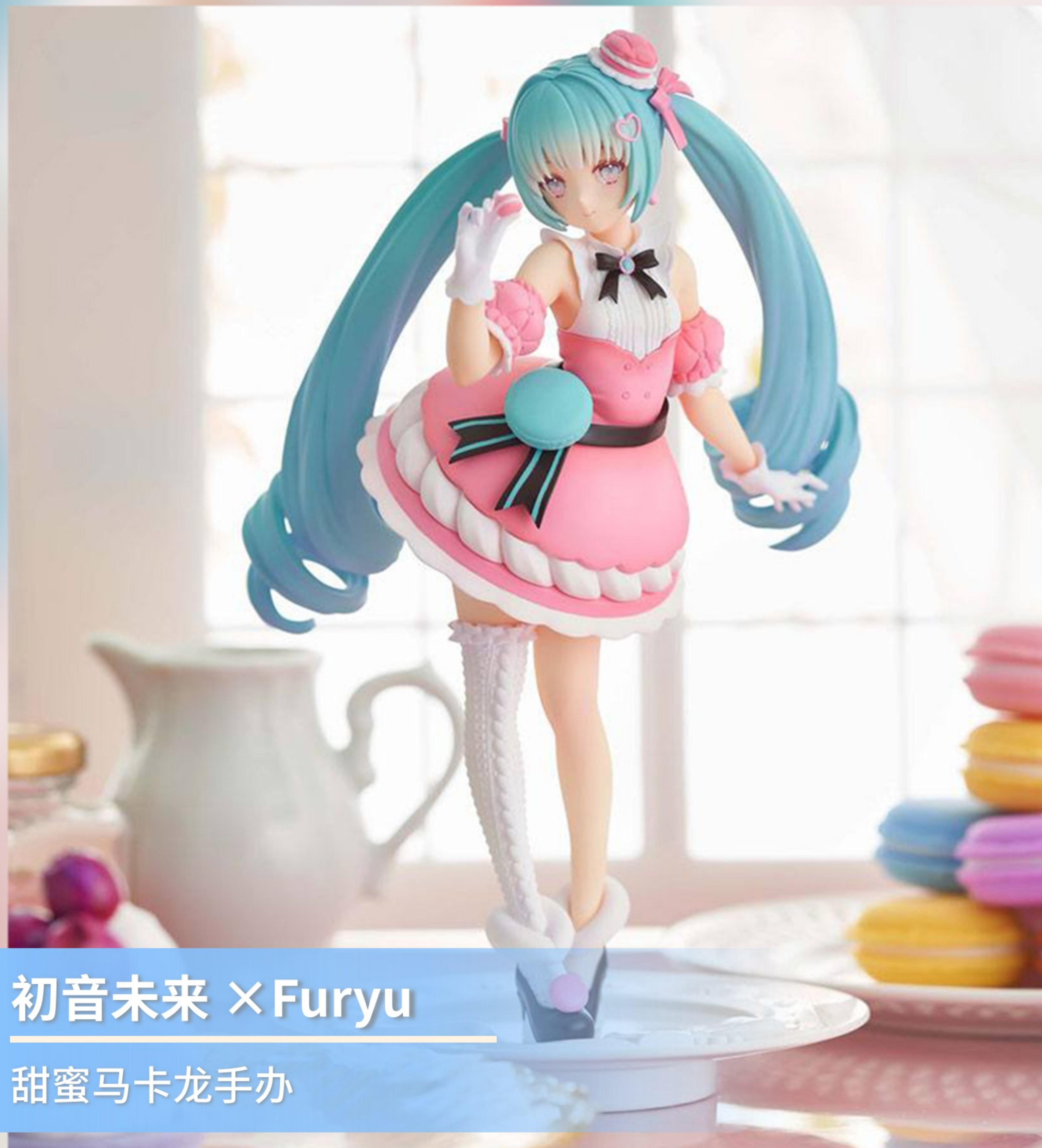
初音未来 × Furyu