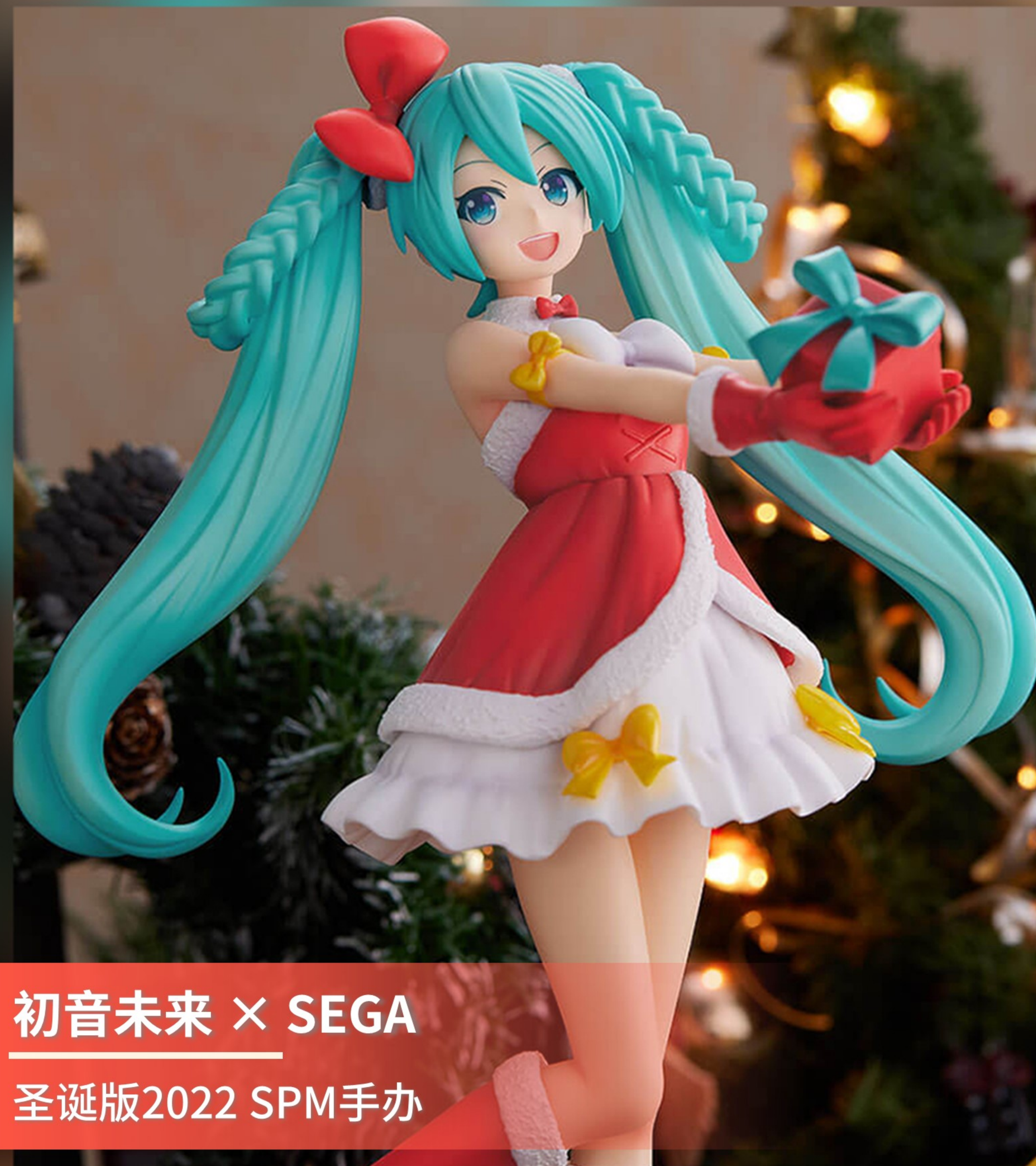
初音未来 × SEGA