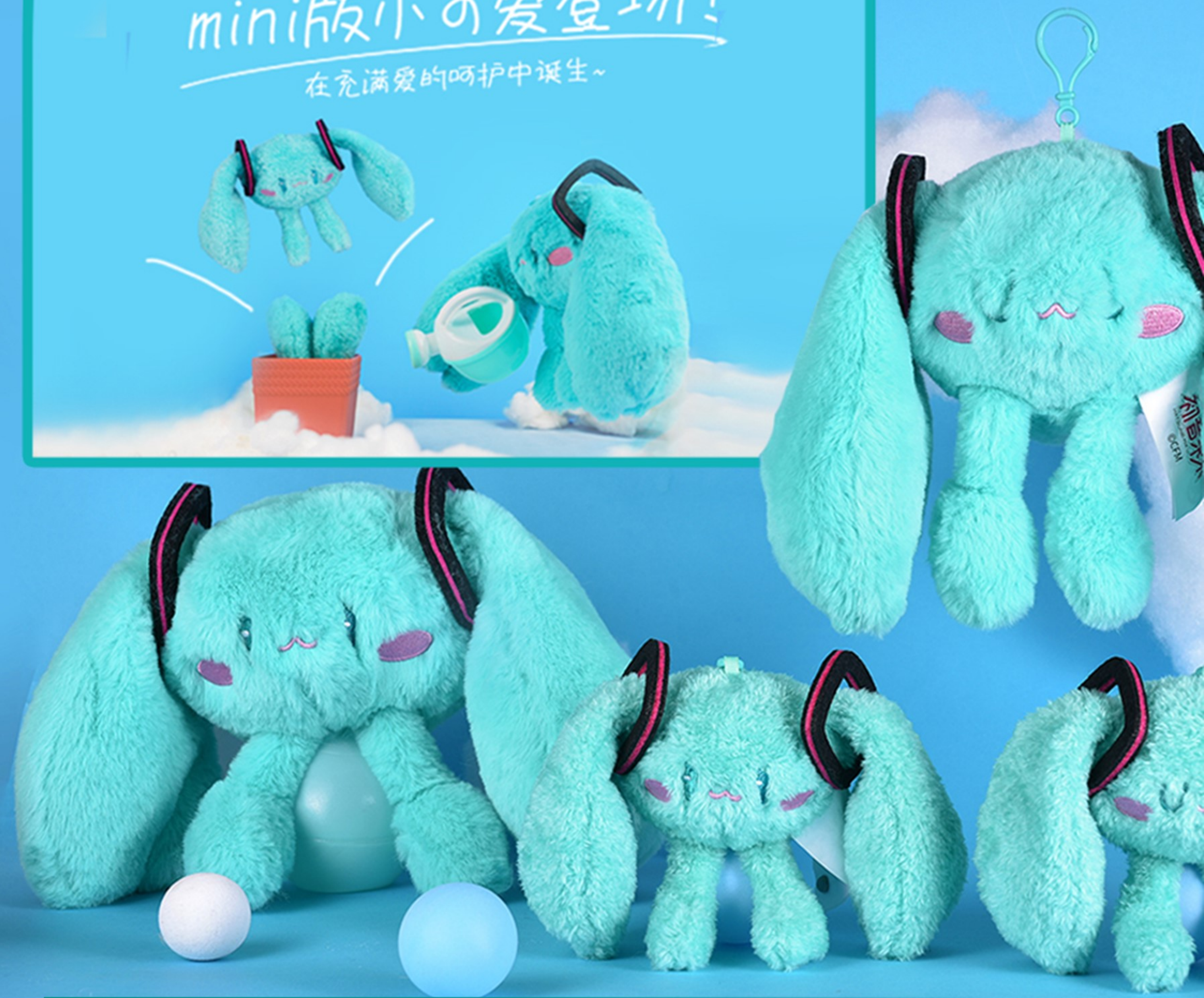
BEMOE可爱体系列迷你毛绒挂件