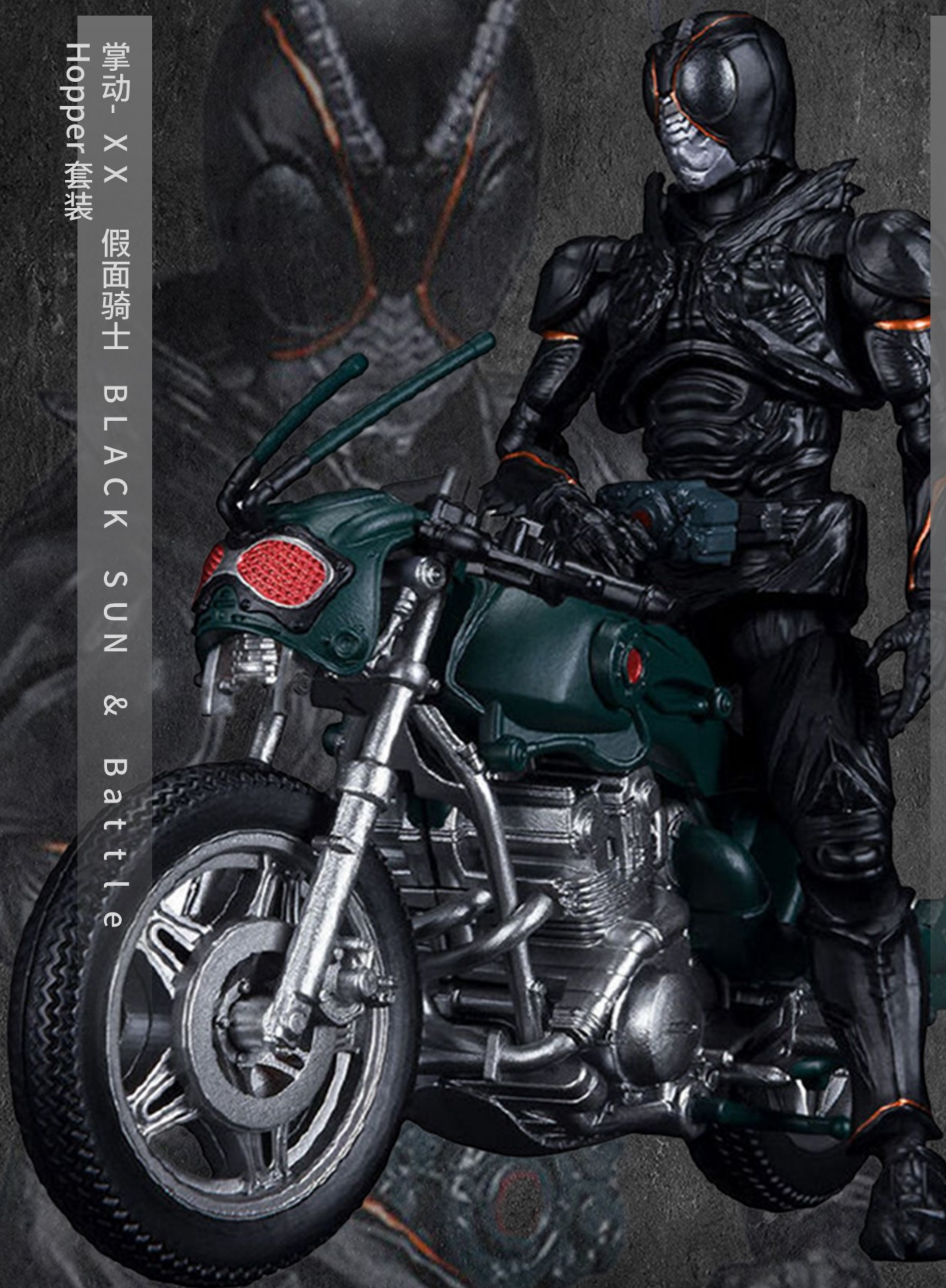
掌动 XX 假面骑士 BLACK SUN & Battle Hopper 套装