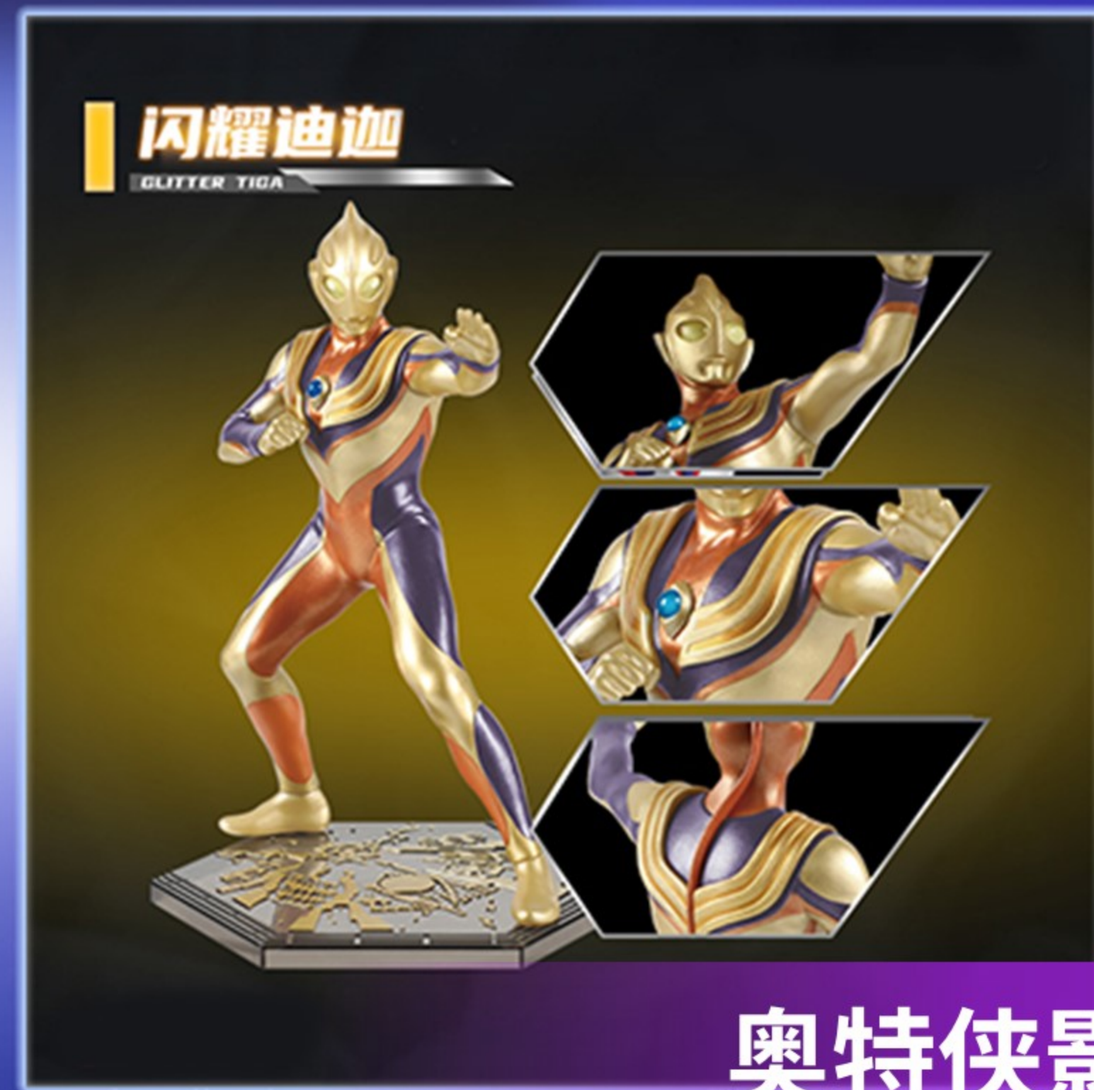
奥特侠影 手办第二弹