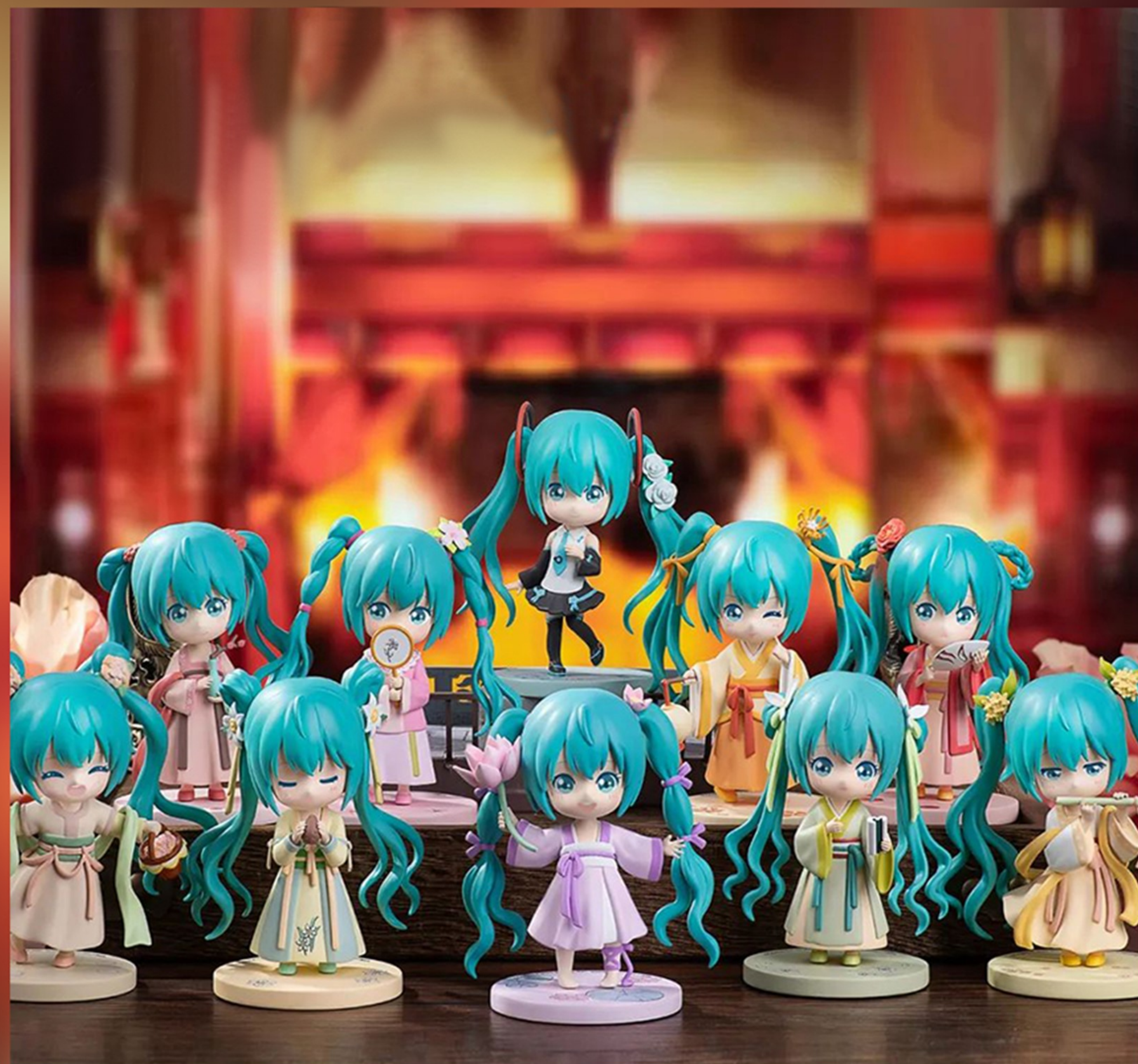
初音未来曲云裳系列盲盒